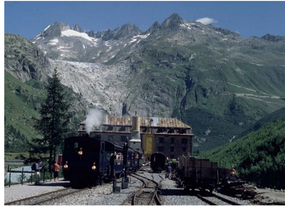
Bahnhof Gletsch mit Rhonegletscher