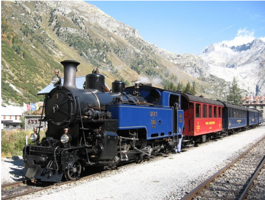
Bahnhof Gletsch mit Rhonegletscher